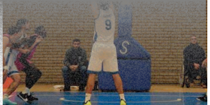
Els pratencs es van imposar al Joan Busquets al Menorca per 92-79.