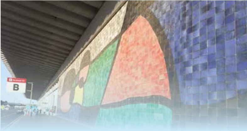
El mural de Joan Miró i Josep Llorens.