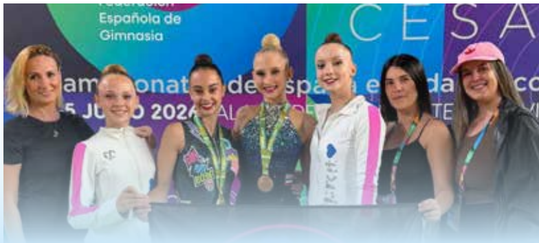
Les gimnastes de l'equip potablava flanqueades per l'equip tècnic.