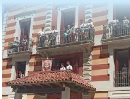
Un instant de l'actuació dels Músics a la Torre Balcells.

J. M. / En ple matí de mercat de pagès, els Músics de Diables, el grup de percussió més veterà de la Colla de Diables del Prat, va sorprendre tota la plaça Pau Casals amb la interpretació d'un dels seus temes més coneguts (amb el que van guanyar un dels sis primers premis de percussió tradicional de