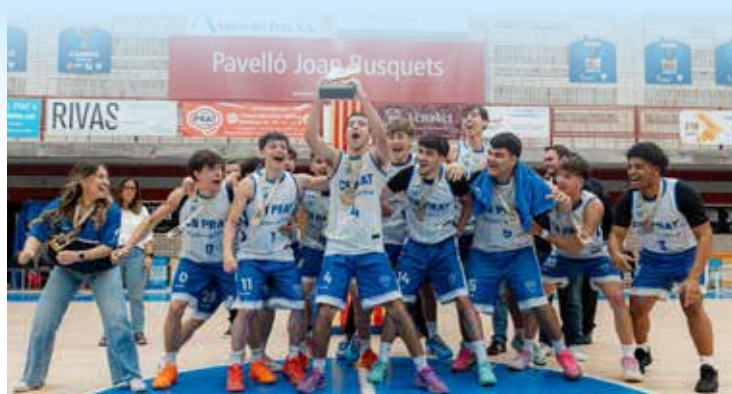
programa campio de Catalunya Interterritorial.

DELTA / Temporada per emmarcar del Júnior A del CB Prat, que ha culminat el curs proclamant-se campió de Catalunya Interterritorial en la fase final disputada al Prat. El conjunt entrenat per Roser Cabezas va aconseguir el títol a l'imposar-se al Blanes per un ajustat 81 a 80 que es va resoldre a la pròrroga. ◀