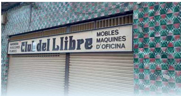
Façana enrajolada de l'antic local de Servei Secretaria.

lladar el seu negoci -que segueix actiu- a un local proper, al mateix carrer Castella, però al N° 30.