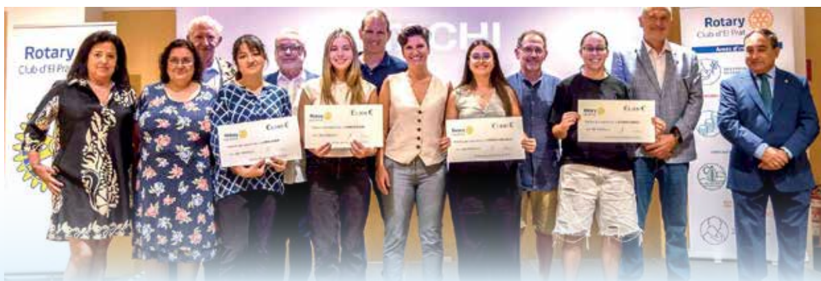
Foto de família amb les premiades, responsables del Rotary i autoritats convidades