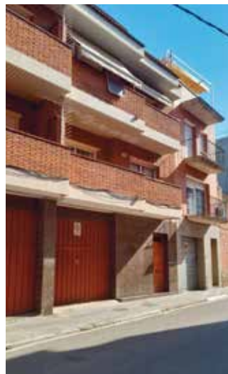
L'habitatge d'emergència del Passatge Cerdanya

La família havia estat allotjada en una habitació d'emergència per més de dos anys entre 2019 i 2022 en una llar compartida al Passatge Cerdanya de la ciutat amb altres persones