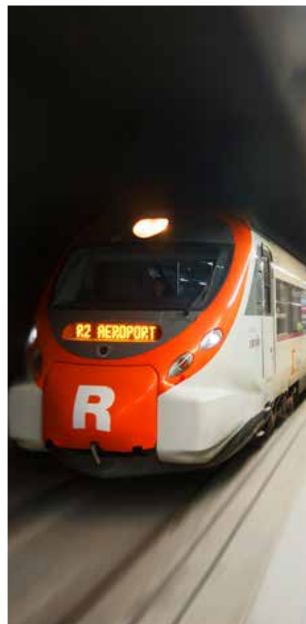
Tren actual de l'aeroport, a l'estació de Rodalies del Prat

La connexió definitiva entre les terminals de l'aeroport i Barcelona podria estar enllestida el 2023. El nou servei de llançadora es farà amb 10 nous trens, amb capacitat per a 600 viatgers i especialment dissenyats tenint en compte les necessitats de les persones amb mobilitat reduïda. La fàbrica Alstom de Santa Perpètua de Mogoda serà l'encarregada de fabricar els combois. ◀