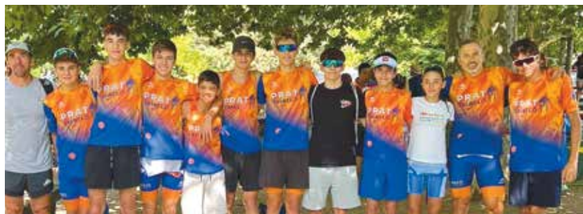
Els pratencs van tornar d'Almazán amb molts podis