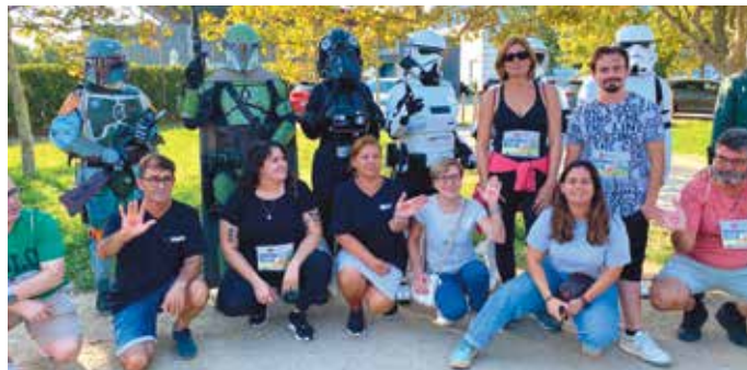
Ambient festiu en una nova edició de la Caminada de l'AEMS / Foto: F. SERRANO