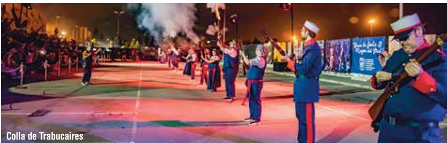
Colla de Trabucaires

senta el seu primer àlbum on incorpora cançons ja conegudes que ha publicat en aquests dos anys de carrera.