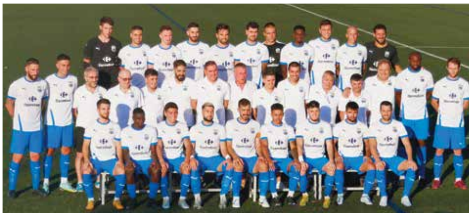
Plantilla AE Prat 2022-23 / Foto: F. SERRANO