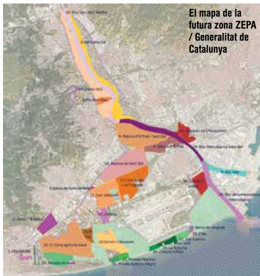
El mapa de la futura zona ZEPA / Generalitat de Catalunya

Els detalls del projecte publicat mostren la voluntat de convertir en zona ZEPA terrenys considerats actualment com a IBA (Important Bird Area), a la vegada que es proposa també l'ampliació en una mateixa proporció del LIC (Llocs d'Interès Comunitari). D'aquesta manera, la zona ZEPA