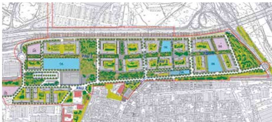
Esquema d'ordenació urbanística del futur sector Seda-Paperera

El nou barri suposarà “el creixement més important dels darrers mandats al nostre municipi, no només en extensió sinó per la possibilitat que hem tingut de planificar com volem que sigui la nostra ciutat en el futur”, va assegurar Bou. Els solars que van deixar buit el tancament de La Seda i La Paperera s'urbanitzaran incorporant millores respecte als dos projectes anteriors. La primera de les modificacions que el farà “més adequat als reptes del futur” serà un pla d'habitatge que preveu la construcció de 5.410 pisos, dels quals 2.414 seran de protecció oficial, i d'aquests, 1.050 de