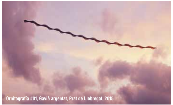
Ornitografia #01, Gavià argentat, Prat de Llobregat, 2015