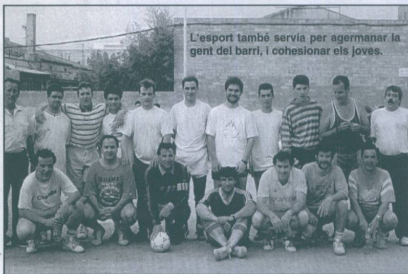
L'esport també servia per agermanar la gent del barri, i cohesionar els joves.

deu persones que eren contràries a la meua presència. Per evitar friccions, calia alguna cosa que posés pau entre tots. Així, quan l'any 1982 vaig tornar a fer-me càrrec de la presidència de l'Associació, vaig posar molt d'interès en fer el primer homenatge als avis de la Barceloneta. Aquest acte va ser important, ja que va aconseguir apaivagar els ànims. En