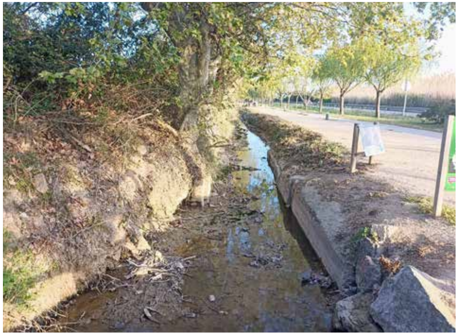
La xarxa de regadiu del Prat ja es nodreix totalment d'aigua regenerada

Pel que fa a les actuacions municipals per tenir una xarxa de distribució de l'aigua