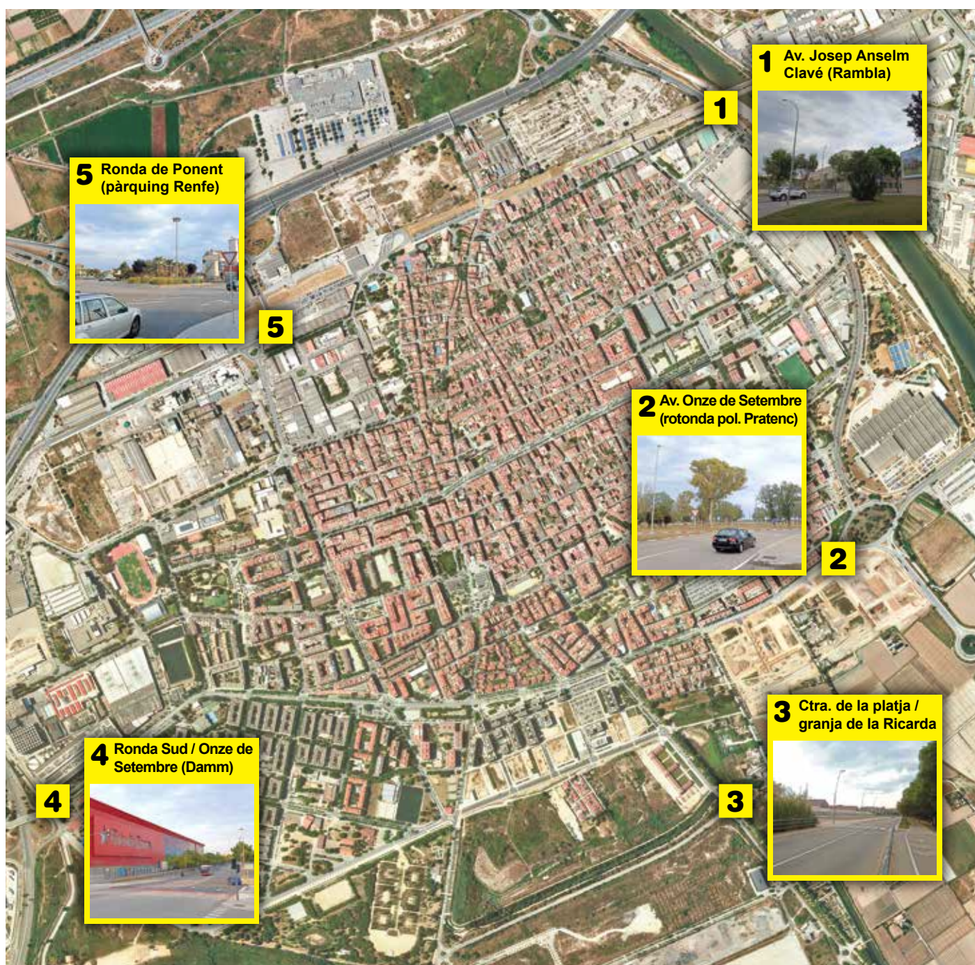
Punts de control perimetrals segons el projecte de ZBE del Prat