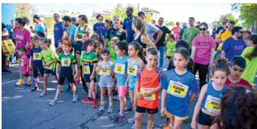
Els més petits van gaudir, un any més, de les curses infantils