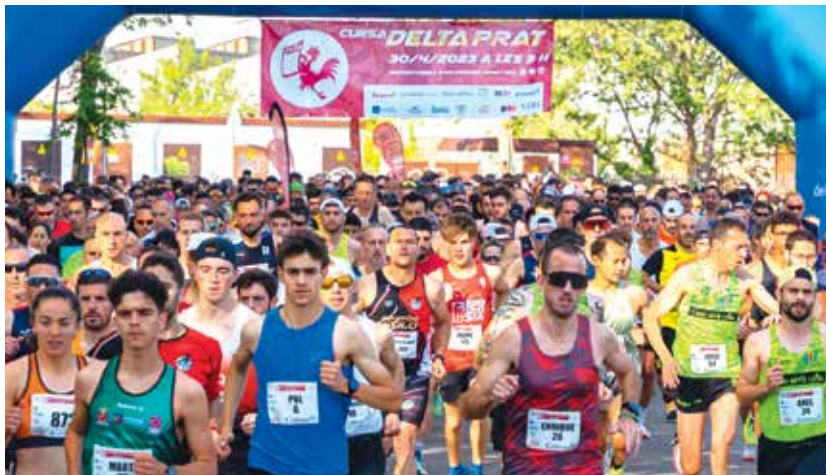
La Delta Prat s'ha refermat com una de les curses amb més tradició del calendari català