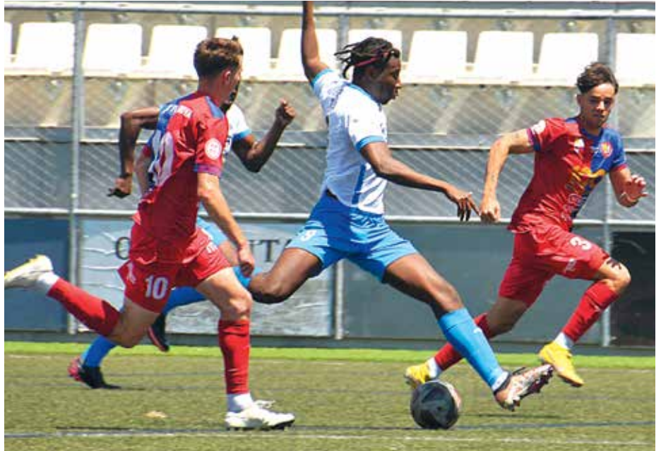
Desgraciadamente de nada sirvió la victoria en casa por 3-1 ante el Olot

De nada serviría la victoria unas semanas antes en Manresa por 1-2 i el empate (0-0) en el Sagnier ante el Terrassa. ◀