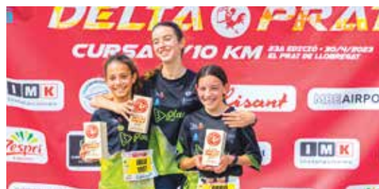
Un dels podis infantil on els esportistes del Triplay el van copar