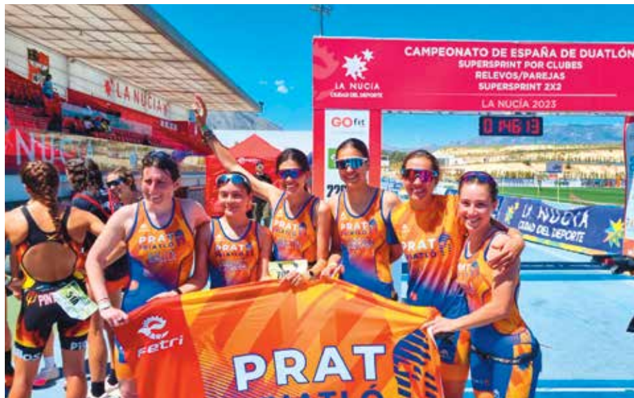
El conjunt femení de Duatló ha pujat a la Primera Divisió per la porta gran

Per la seva part, el conjunt masculí també va guanyar l'ascens a Primera Divisió després de quedar en la tercera posició final de la classificació general.. ◀