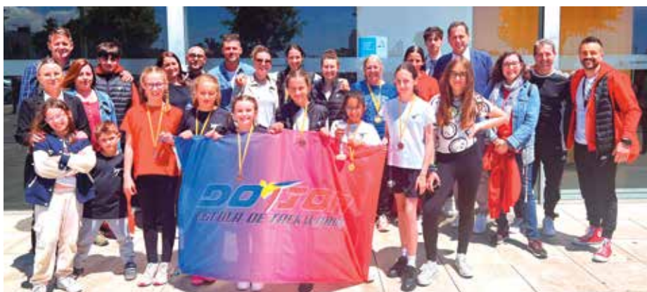
A dalt, la delegació del Gym Studio Fran Martín als Campionats de Catalunya Infantil va ser una de les més nombroses de la competició. A baix, l'equip Do Jon a les portes del pavelló la Mar Bella de Barcelona / Foto: GSFM/DJ

del Do Jon, es van proclamar campions de Catalunya de la categoria sub 21.