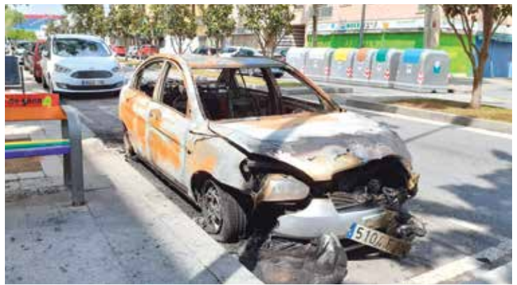
A l'esquerra, imatge de les plantacions; a la dreta, els aldarulls de dies posteriors van provocar la crema de contenidors i algun vehicle / Fotos: CEDIDA PER MOSSOS D'ESQUADRA