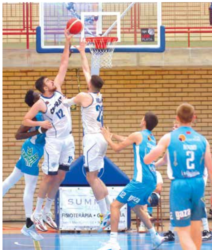
Malgrat la derrota al Joan Busquets davant Zamora, els pratencs van solucionar l'eliminàtoria / Foto: F. SERRANO

Esgotada aquesta opció, s'entrava als play-offs com a cap de sèrie amb l'enfrontament amb el Zamora guanyant a la seva pista per un clar 68-84 que deixava molt favorable l'eliminàtoria encara que el partit de tornada no va ser fàcil i els pratencs van patir la derrota encara que per només 6 punts (73-79) que donava pas a la definitiva confrontació per decidir l'equip que acompanyaria al Burgos a la segona categoria del bàsquet estatal.