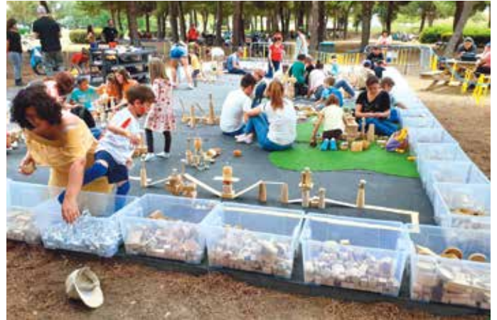
Fundesplai va omplir el Parc Nou d'activitats per a infants i joves

A la campanya de Fundesplai, les famílies podran trobar des de bressols i casals d'estius pels infants fins a camps de treball pels joves fins als 18 anys, passant per les tradicionals colònies i campaments. Destaquen el casal que es fa al Museu d'Història de Barcelona, les colònies per gaudir de la natura i els esports de muntanya (curses d'orientació, BTT, etc.), en anglès o de programació, els camps tecnològics d'Intel·ligència Artificial i Drons, els de música i periodisme -que comptaran amb el grup Xiula i els cantants Mariona Escoda i Edu Esteve-, els de biologia marina o els camps de treball, per recuperar zones d'interès natural i social.