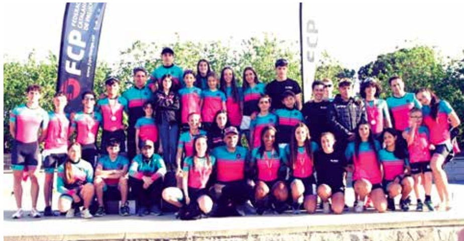
A l'esquerra, l'equip del CP Ciutat del Prat va guanyar un total de 22 medalles entre els Campionats de Catalunya en Pista i Circuit. A la dreta, representació del CPV El Prat als Campionats de Catalunya