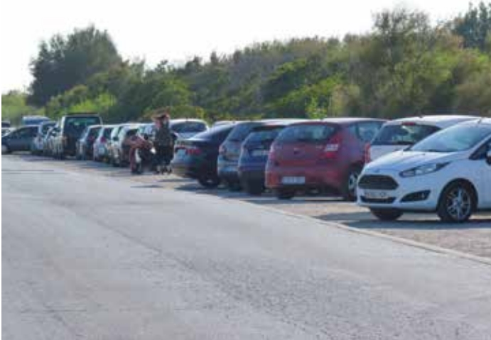
Vehicles barrejats en línia i bateria, a partir del CRAM