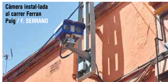
Càmera instal·lada al carrer Ferran Puig