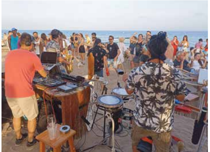
Actuació en un dels locals de la platja

rar-se quedant el camí lliure pels hereus del Duna, que oferien un cànon bastant inferior de 14.750 euros, aportant molts menys diners dels previstos a les arques municipals.