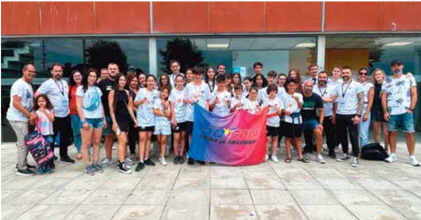
Un total de cinc medalles d'or van aconseguir els esportistes del Studio Fran Martín al Campionat de Catalunya Infantil