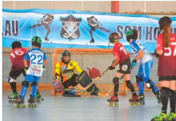
El CH Prat va organitzar el 8è Torneig Pota Blava

T. E. / Al llarg de tot el primer cap de setmana de mes el pavelló del CEM Sagnier va acollir el 8è Torneig Pota Blava d'Hoquei sobre patins organitzat pel Club Hoquei Prat per a les categories; prebenjamí, benjamí, aleví, infantil i veterans. Una competició que va comptar amb un gran nombre d'equips d'aquí com; el Martinenc, Llars Mundet i Corbera així com de la resta de la geografia espanyola com; el Tudela de Navarra, el Cajar de Granada i el Coslada de Madrid. Un gran torneig que ha posat el punt final de la temporada i on es va poder observar un gran nivell d'hoquei de promoció. Malgrat tot, i no aconseguir guanyar en cap de les categories el Club Hoquei Prat, va ser un gran amfitrió organitzant un torneig d'alt nivell esportiu i de públic.