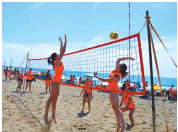
El Vòlei Platja va tornar a la platja del Prat

Diumenge es va disputar una única categoria el 2x2 mixta on la