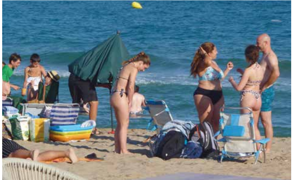
La del Prat segueix sent una platja ideal per a moltes famílies

Als problemes endèmics de pèrdua de sorra i limitacions d'accés i aparcament, se li sumen enguany conflictes amb la licitació de guinguetes. Tot i això, la platja no perd el seu gran atractiu per centenars de milers de visitants