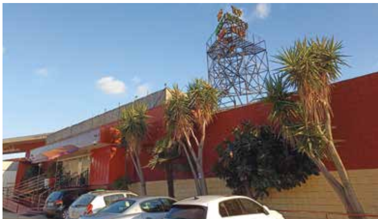
Imatge del Top Models, on s'havien construït de manera il·legal 6 habitacions per exercir la prostitució

El procediment es va iniciar el 6 de juny, amb un expedient de protecció de la legalitat urbanística incoat per la tinenta d'alcalde