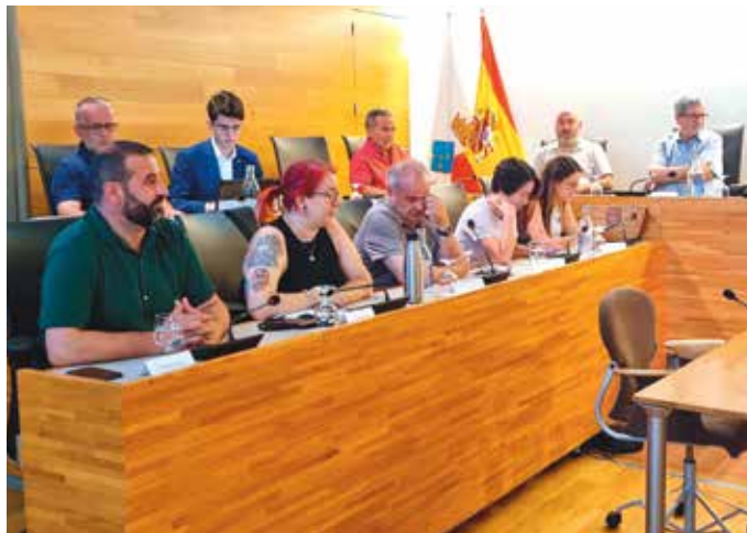
Un instant del ple del 6 de juliol

agudo, va anunciar que el seu partit renunciaria a l'assignació pressupostària que li pertoca, 6 mil euros anuals fixos i 6 mil euros més per cada regidor aconseguit, un total de 72 mil euros al llarg del mandat. "Aquests diners se'ls hauria de proporcionar cada partit a les agrupacions locals per fer les seves activitats".