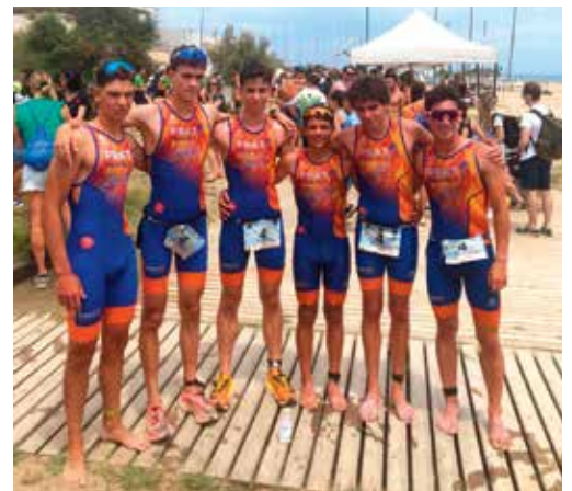
Exhibició de l'equip jove del Prat Triatló 1994

En categoria femenina, medalla de xocolata per l'equip pratenc que només van poder assolir la quarta posició. El podi femení va ser per CE Katoa Barcelona, CN Mataró i CN Barcelona, respectivament.