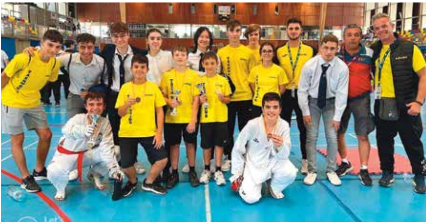
Àmplia representació del Do Jon al Campionat de Catalunya Infantil amb tres medalles d'or