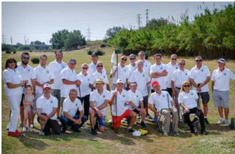
Integrants de l'Associació de Golf Rústic El Prat al camp on practiquen el seu esport