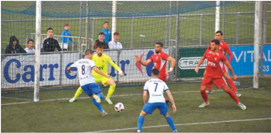
Encuentro de la AE Prat ante el Terrassa de la pasada temporada en Segunda RFEF