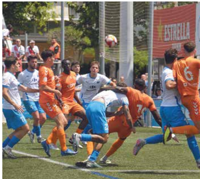
L'AE Prat tornarà a jugar la temporada vinent en Tercera Federació