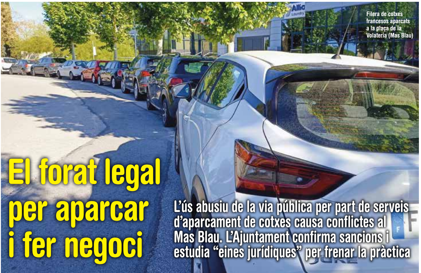
Filera de cotxes francesos aparcats a la plaça de la Volateria (Mas Blau)