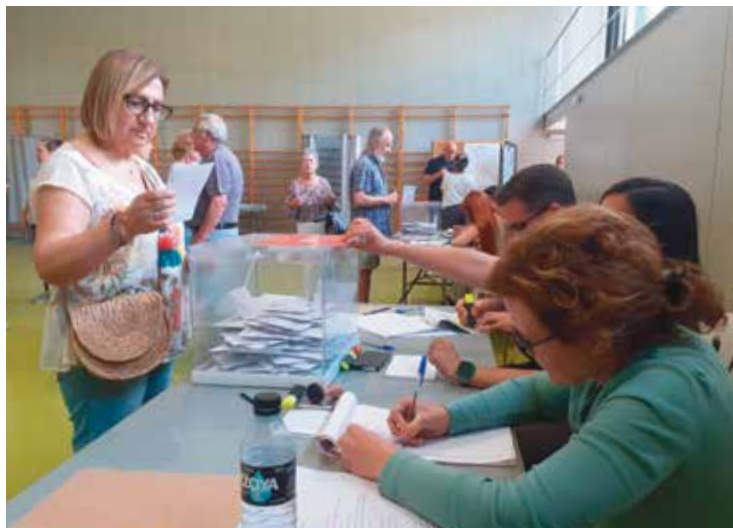
Votació en un dels col·legis durant la jornada

Un 41,44% dels que sí que es van mobilitzar, es va decantar per la papereta de