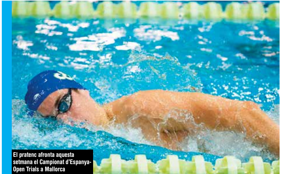
El pratenc afronta aquesta setmana el Campionat d'Espanya-Open Trials a Mallorca

■ L'any passat vas canviar d'equip i vas aterrar al Club Esportiu Mediterrani.