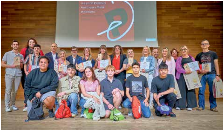
Foto de grup amb representants dels premiats i autoritats municipals