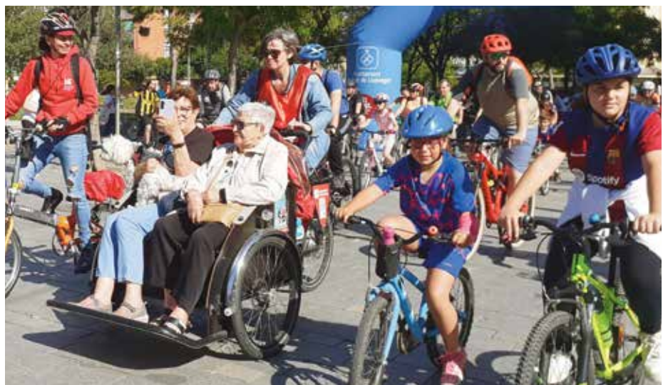
Molta gent va participar un any més a la Festa de la Bicicleta

DELTA / Un any més la bicicleta va ser el vehicle estrella pels carrers de la ciutat amb la tradicional Festa de la Bicicleta que es va celebrar el primer diumenge de juny. Enguany el recorregut de 10 km iniciat per tots els participants en la plaça Catalunya no va acabar com anys anteriors en el Parc del Riu i ho va fer al Parc Nou on es va desenvolupar el típic esmorzar i la resta d'activitats esportives relacionades amb la bicicleta. Circuits d'habilitats, tallers ciclistes de decoració i neteja, passejades en tricicles adaptats per a la gent gran, així com les classes magistrals de zumba i bodybalance, van ser algunes de les activitats de les quals tots els participants van poder gaudir d'aquesta festa ja tradicional dintre del calendari esportiu popular de la ciutat. ◀