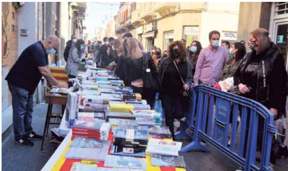
La festa de Sant Jordi es va traslladar al Fondo d'en Peixo per evitar aglomeracions durant la pandèmia a l'entorn de Ferran Puig