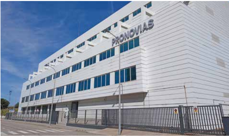
Seu de Pronovias al polígon Mas Mateu / Foto: F. SERRANO