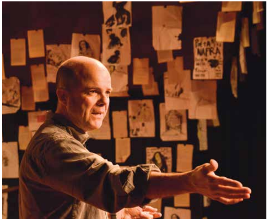
Imatge de Xavier Giménez Casas de l'any 2016

Xavi Giménez també va ser l'autor del llibre Teatre Kaddish 20 anys 20 (1995),