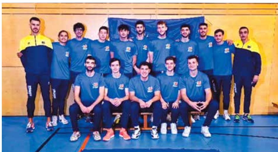
El sénior A masculí dels Vikings jugaran a Superlliga 2 la temporada vinent

T.E. / La presència del primer equip masculí dels Vikings Vòlei Prat a Superlliga 2 es dona per fet. En el moment del tancament d'aquesta edició, l'entitat ha assenyalat a Delta que les perspectives són molt optimistes i que l'objectiu d'aconseguir el finançament va pel bon camí. Després de l'ascens aconseguit fa unes setmanes del conjunt pratenc, el club es va posar en marxa per aconseguir el fons necessari perquè l'equip pratenc pogués jugar la temporada que ve a la categoria de plata del voleibol espanyol. Per tant, si tot és així, els Vikings que precisament aquest any celebren el seu 30è aniversari, podrà definitivament competir l'any que ve a la Superlliga 2. La campanya