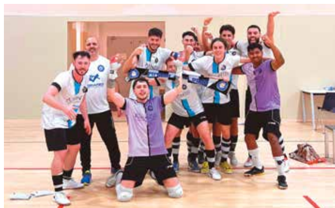
El primer equip del Futbol Sala Prat Advantis va aconseguir l'ascens a l'última jornada en joc

L'actualitat de l'entitat de futbol sala potablava es completa amb l'ascens també del juvenil A preparat per Pedro Palacios a Preferent i del campionat aconseguit per l'equip aleví femení entrenat per Marcos Palacios. ◀