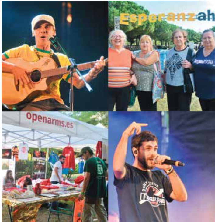
"Quinze anys plens de moments memorables al Parc Nou"

de cada edició es donen a causes i projectes d'economia social i cultura transformadora". Afegeixen que "les persones voluntàries que conformen la cooperativa i l'organització hem decidit prendre'ns un descans, reflexionar i repensar una nova etapa per aquest projecte", no tancant la porta ni molt menys a tornar a recuperar la cita en un futur.