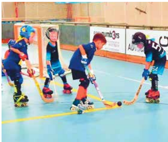
El CEM Sagnier va viure un cap de setmana de molt i bo hoquei