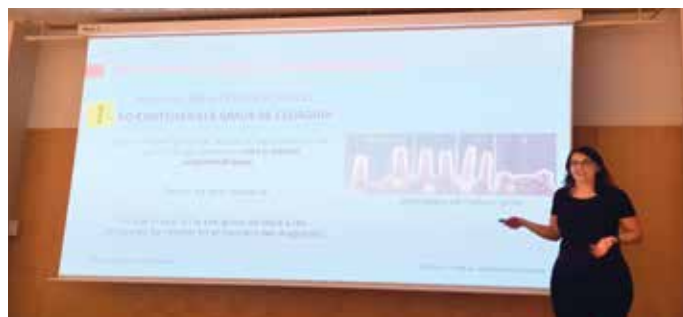
Míriam Baños durant un moment de la xerrada al Palmira Domènech

Començant amb la definició de celiaquia, Míriam Baños, vo-