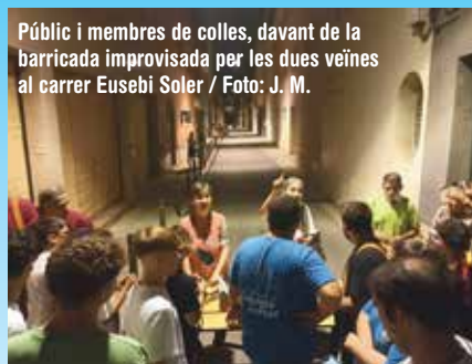
Públic i membres de colles, davant de la barricada improvisada per les dues veïnes al carrer Eusebi Soler

Des de l'Associació de Veïns volen que l'Ajuntament s'impliqui "reunint totes les parts per buscar l'entesa". "Estem a disposició de tothom. Això sí, serà necessari va-