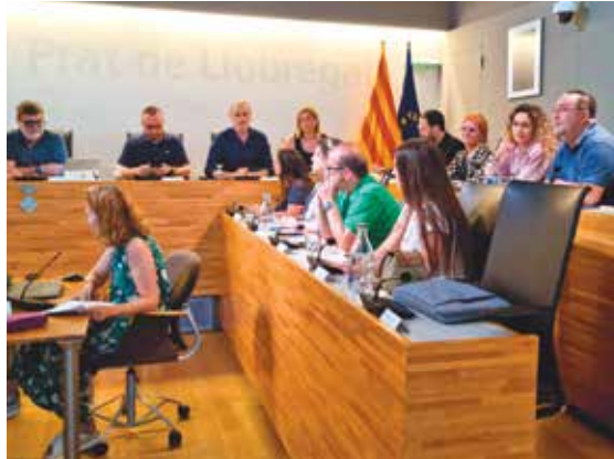
Portaveus dels grups durant una sessió del ple