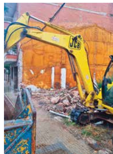
Han començat les obres de neteja del solar on es farà l'aparthotel

NEUS MACÍAS / Un apartament de 2 estrelles amb 29 apartaments en la modalitat d'estudis s'ubicarà al carrer Coronel Sanfeliu N° 127-129, després de la demolició d'un habitatge unifamiliar i un garatge situats a aquella adreça. En les darreres setmanes ha començat la construcció de l'edifici, que es troba envoltat de petites cases de planta baixa o dues plantes, després de diverses modificacions en la llicències d'obres atorgada a la promotora. El nou projecte preveu una segona fase per tal de recuperar la planta soterrani que existia en una primera versió del document. La companyia darrera d'aquesta construcció és Sun&Moon Light S.L., una societat limitada que té com a objecte la gestió i explotació d'hotels, amb seu social al barceloní carrer de Ferran. L'empresa gestiona un hostel al barri Gòtic de Barcelona, amb habitacions individuals i altres compartides, amb o sense bany privat. ◀