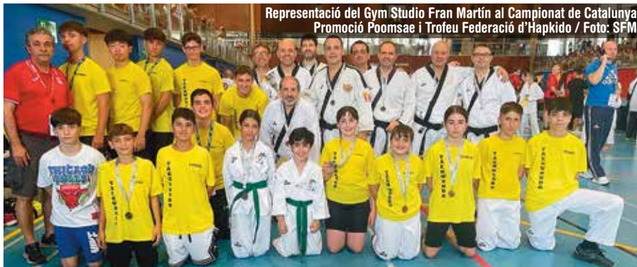
Representació del Gym Studio Fran Martín al Campionat de Catalunya Promoció Poomsae i Trofeu Federació d'Hapkido

T. E. / El taekwondo pratenc continua encadenant èxits i pujant a molts podis a les competicions on es presenten. D'aquest últim mes cal destacar tres competicions importants dos Campionats de Catalunya i un per autonomies a Biscaia. Al Campionat de Catalunya de Promoció Infantil un total de 17 medalles van guanyar els taekwondoques locals i en el de Promoció Poomsae i Trofeu Federació d'Hapkido, 13 més. També ressaltar els bons resultats dels representants po-