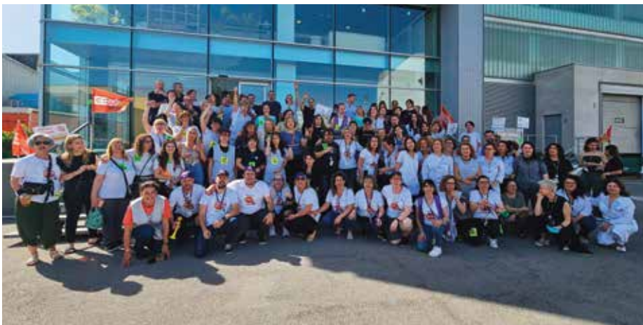
Concentració de treballadors davant de Pronovias