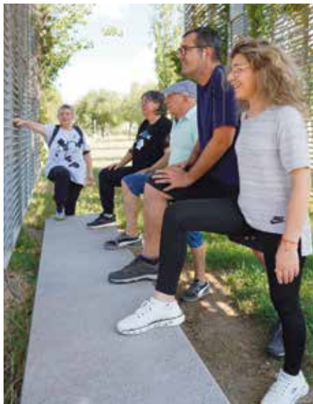
El grup de pacients, durant una de les seves rutines guiades, al Parc del Riu

Habitualment es reuneixen a espais com el riu o el Parc Nou, mantenen el contacte a