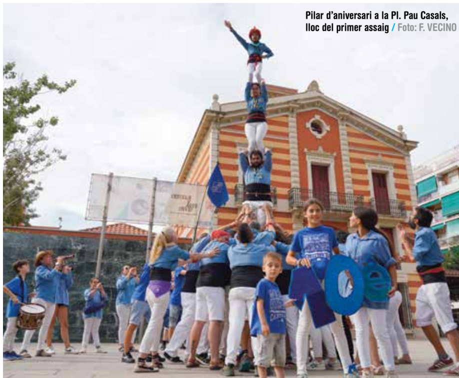
Pilar d'aniversari a la Pl. Pau Casals, lloc del primer assaig

"De tota manera, gaudim de bona salut. Cada diada descarreguem tres castells i ara tornem a treballar en els de 7, però és important consolidar l'estructura, vejam si podem arribar per intentar-ho a la diada de Festa Major", anuncia Magaldi. Durant el 9è aniversari, per Sant Pere de l'any passat, la colla va aconseguir descarregar un