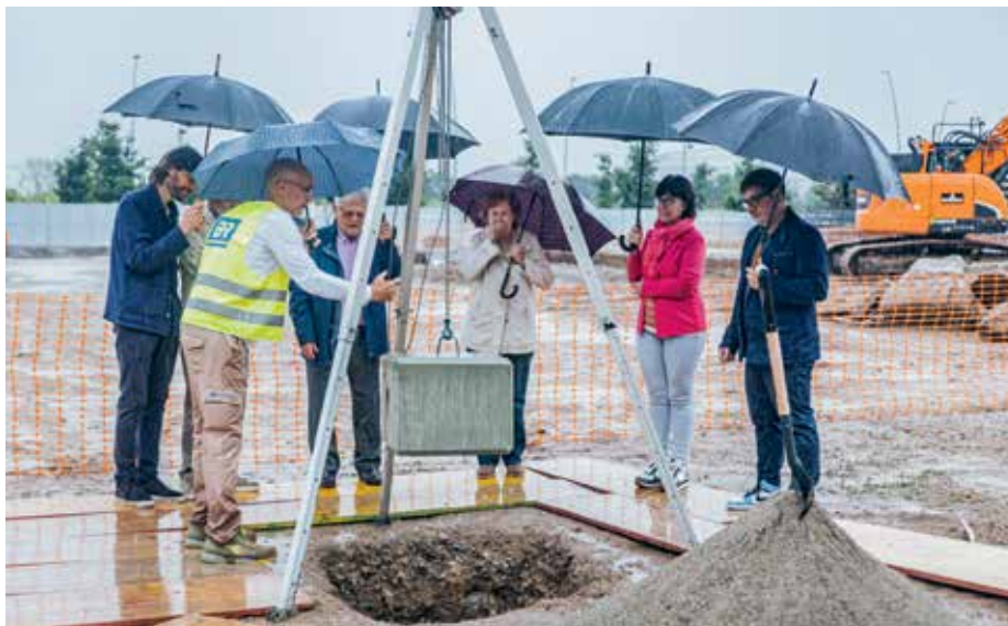
Col·locació de la primera pedra del futur bloc de pisos socials

L'Ajuntament ha cedit la parcel·la, que té un valor de 2 milions d'euros, per un període de 75 anys. L'edifici es finançarà en part amb una aportació de 4,8 milions d'euros