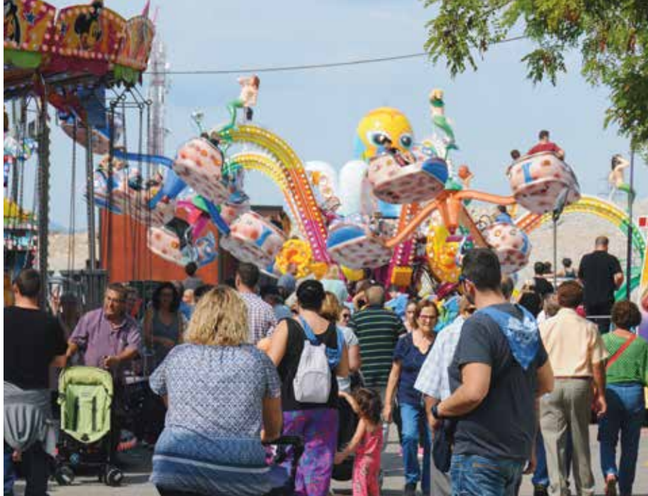
Gent caminant per la zona d'atraccions, ubicada fins a l'any passat a l'entorn del Sagnier

Fins en tres ocasions Mijoler afirma a la carta que aquest emplaçament és "una solució puntual i no definitiva" i que l'Ajuntament treballa "per trobar un recinte firal definitiu que minimitzi l'impacte en zones habitades i que disposi de l'espai