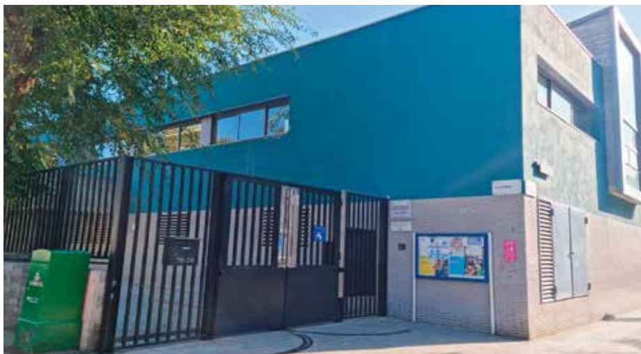
L'Escola Sant Jaume ja disposa de menjador climatitzats