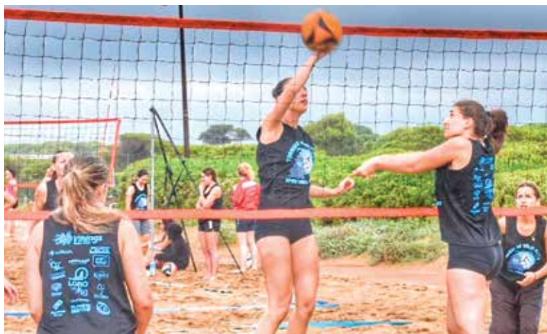
Edició de record la que van organitzar aquest any els Vikings

T. ESPIGARES / Confirmada la presència dels Vikings en la Superlliga 2 el conjunt pratenc ha organitzat l'annual torneig d'estiu de vòlei platja. Enguany rècord de participació en l'Open Lobo de Mar assolint una inscripció total de 320 jugadors i jugadores deguda en part, al canvi d'ubicació de les guinguetes, que va permetre disposar de més espai per instal·lar més pistes. Cal destacar que el conjunt pratenc l'any vinent, comptarà amb una secció al llarg de tota la temporada de vòlei platja gràcies a la nova instal·lació situada al Julio Méndez. ◀