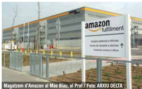
Magatzem d'Amazon al Mas Blau, al Prat

“Denunciem les condicions de treball que pateixen aquestes persones: des de fa uns mesos, aquesta empresa [Ilunion] du a terme els treballs de logística i magatzem que la plantilla d'Amazon es va negar a realitzar per la manca de mesures preventives. Però la manca de mesures preventives, lluny de solucionar-se, ha persistit i fins i tot s'ha