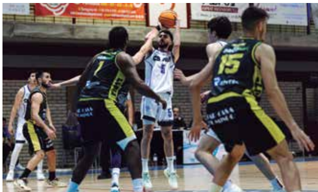
L'últim quart davant Lliria al Joan Busquet va ser desastrós