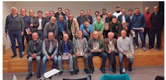
La foto de família amb tots els jugadors i exjugadors presents a l'acte de la presentació del llibre dels cinquanta anys d'història