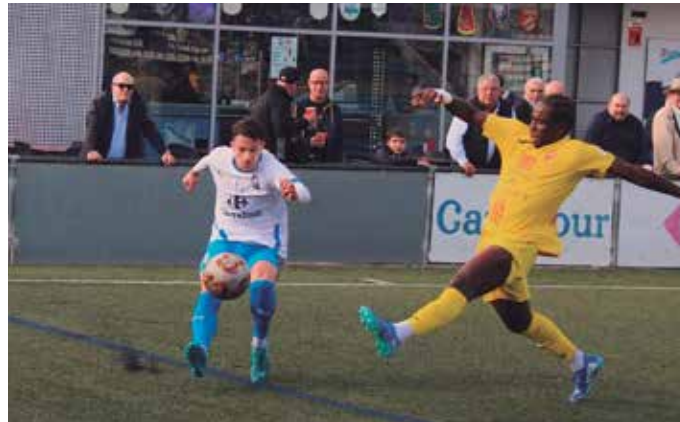
L'AE Prat es col·loca catorzè al costat dels llocs de descens