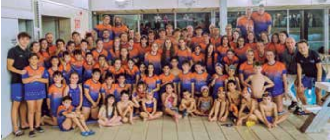
150 nedadors i nedadores conformen el gruix esportiu del CN Prat