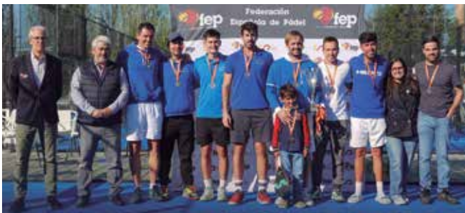
El conjunt pratenc, subcampió de la Copa d'Espanya de Lligues Autònòmiques de 1a Categoria

DELTA / El conjunt masculí de primera categoria del Pàdel Barcelona-El Prat s'ha coronat subcampió d'Espanya després de perdre la final contra l'equip canari de La Palma, el CD Unió Deportiva Baga Tazo 2008, amb un resultat d'1-2. La competició, que es va dur a terme a les instal·lacions del Pàdel Barcelona-El Prat, va reunir 126 equips de tot l'Estat espanyol, destacant els conjunts catalans com la representació autonòmica més exitosa, amb un total de sis podis en diverses categories.