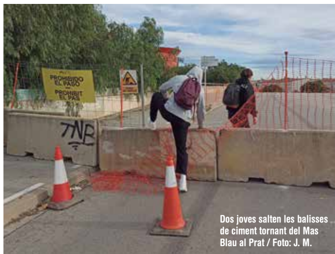
Dos joves salten les balisses de ciment tornant del Mas Blau al Prat