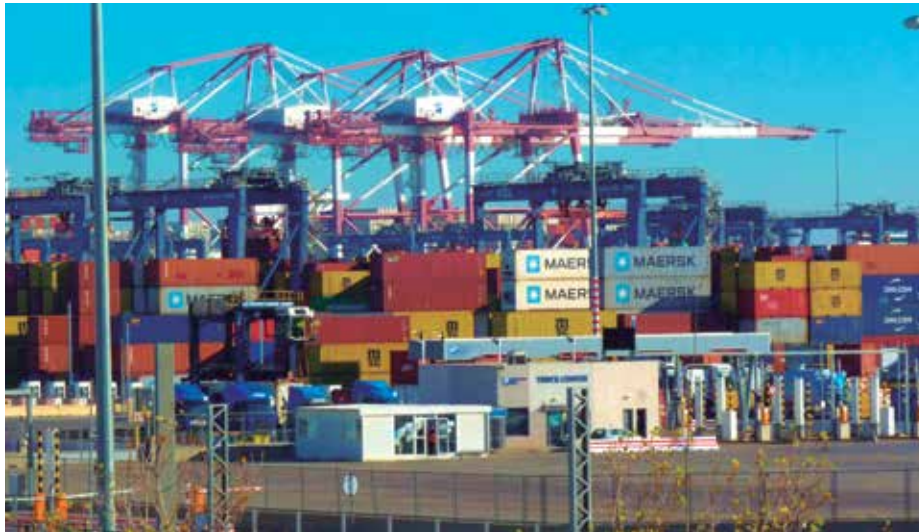
La recaptació de tributs del port (foto) i l'aeroport ja ha arribat al màxim