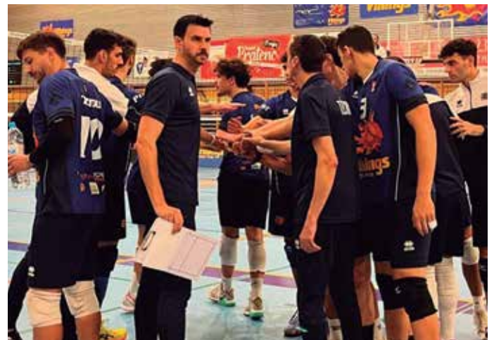
Important victòria del Vikings al Julio Méndez davant Saragossa