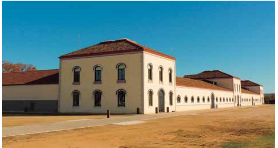
Part posterior de la granja de la Ricarda

Segons l'alcalde, aquesta ha estat una de les parts més complicades de resoldre -"més d'un any de feina per part dels serveis jurídics municipals"-, ja que el conveni fins ara vigent entre l'Ajuntament del Prat i AENA no permetia desenvolupar activitats econòmiques de caràcter permanent en terrenys propietat de l'aeroport. "A més, l'edifici tampoc estava, fins ara, posat al dia pel que fa a qüestions de subministrament d'energia", afegia Mijoler.