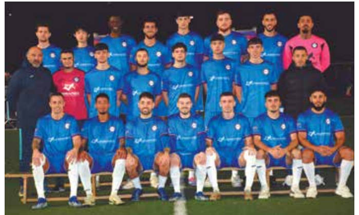
Sènior masculí A del CB Terlenka

DELTA / El Club Barcelonista Terlenka va presentar els seus equips de futbol en un espectacular show davant d'una afició entregada. Actualment, compta amb 557 jugadors en 39 equips, incloent-hi 2 equips amateurs masculins i 1 femení. El primer