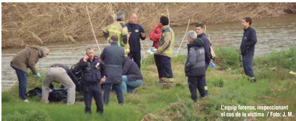
L'equip forense, inspeccionant el cos de la víctima