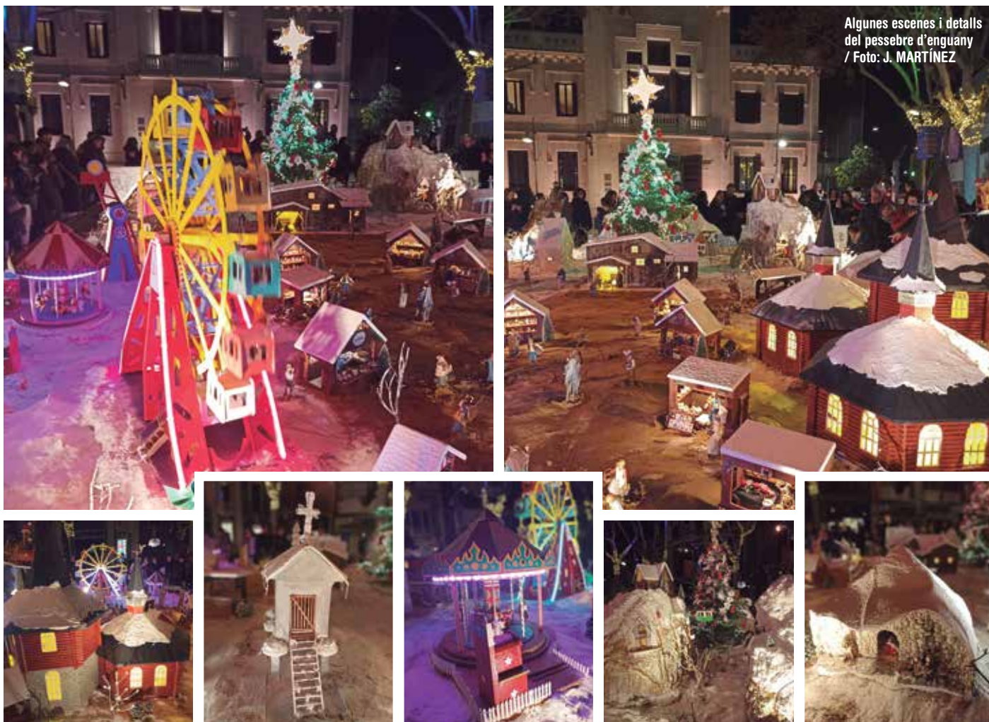
Algunes escenes i detalls del pessebre d'enguany