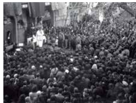
Missa de campanya a la Plaça de la Vila, davant del Modern (25-1-1939)

projectils republicans a Cal Mora i habitatges del carrer Santiago Rusiñol. Aquell dia el nou consistori franquista va inaugurar la Creu dels Caguts a la plaça de l'Església i es creà la Comisión de Recuperación Agrícola , encarregada de revertir les col·lectivitzacions. El primer punt de la primera reunió del consistori fou " hacer patente el sentimiento de su más entusiasta admiración por el Glorioso Ejército Nacional que ha liberado a este pueblo de la tiranía roja ".