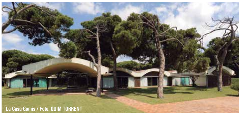
La Casa Gomis

Una iniciativa del ministeri de Cultura comandat per Ernest Urtaun (Comuns/Sumar) en plena polèmica pels plans d'ampliació de l'aeroport