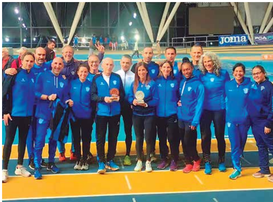
L'equip pratenc amb els dos trofeus