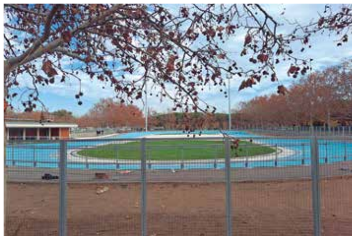
Es preveu que la nova instal·lació s'inauguri abans de la finalització del primer trimestre

El vell patinòdrom del CEM Estruch serà substituït per dues pistes poliesportives a partir del maig/juny de 2025, i tota l'activitat de patinatge es traslladarà al nou equipament. Posteriorment, es crearà un camp de futbol 7 i s'ampliarà el complex esportiu. ◀