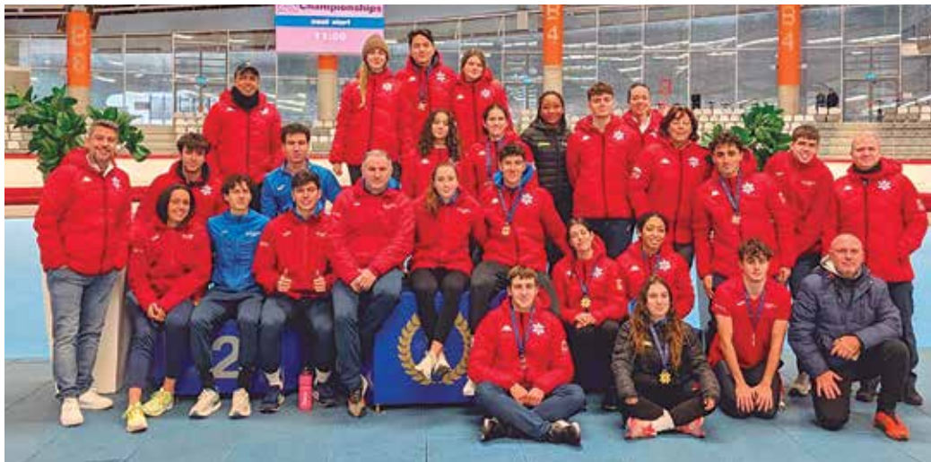
La delegació espanyola al Campionat d'Espanya que es va celebrar a Alemanya

DELTA / El primer Campionat d'Espanya de Patinatge de Velocitat, organitzat per la RFEDH a l'oval Max Aicher Arena d'Ale-