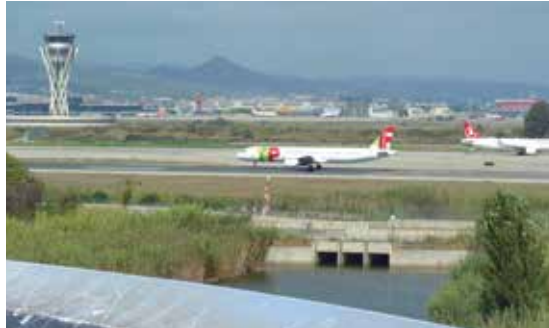
Les pistes de l'aeroport, des del mirador de l'Illa

Els 55 milions de passatgers, recordem, és la "xifra mantra" que en teoria indica el límit d'usuaris anuals que l'aeroport del Prat és capaç de gestionar amb solvència i amb les dimensions actuals. Gestionar un nombre superior de viatgers, segons els postulats d'Aena, compartits ara de ple pel Govern socialista de Salvador Illa, passa