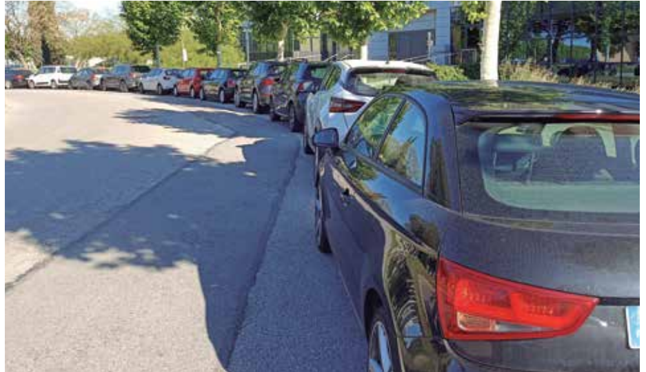
Vehicles estacionats al Mas Blau

Ara, des de l'àrea municipal de Mobilitat confirmen un pas més per mirar de solucionar el problema. "Hem arribat a un acord