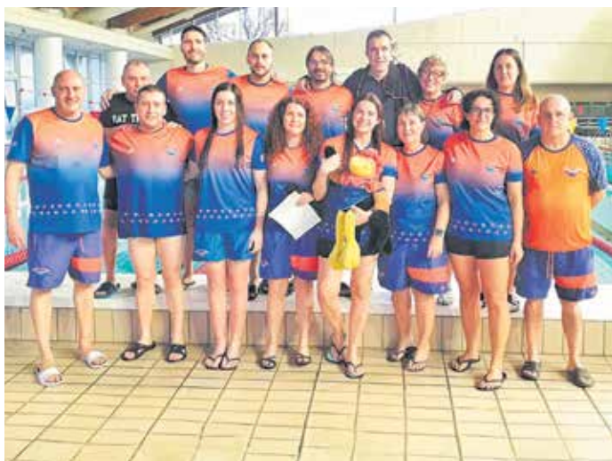
L'equip màster pratenc al Trofeu Ciutat del Prat.

Aquesta competició per a esportistes veterans va reunir 128 nedadors i nedadores de 25 equips d'arreu de Catalunya i forma part de la sisena etapa del Circuit Català de Trofeus de Natació Màster, que inclou un total d'11 etapes durant la temporada d'hivern i 5 d'estiu. De l'actuació del conjunt pratenc, cal destacar els 8 rècords del club i diverses millors marques personals. ◀