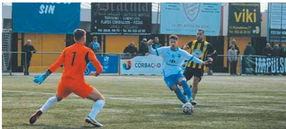
Un punt va treure l'AE Prat del camp de la Montanyesa.