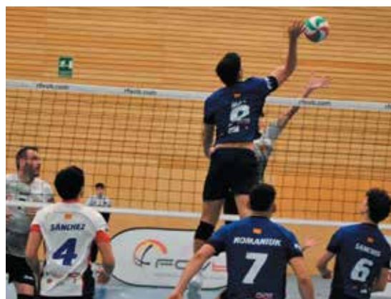
Els Vikings es fan forts al Julio Méndez / Foto: VIKINGS VÒLEI PRAT

DELTA / El Campionat de Catalunya per Equips de Veterans de Primera va coronar al conjunt masculí del Pàdel Barcelona-El Prat i al femení de l'Emilio Sánchez Club Esportiu com campions en categoria màster. En categoria masculina el Pàdel Barcelona-El Prat va vèncer en la final d'una forma contundent al Pàdel Osona per 4-1. Mentre que en categoria femenina l'Emilio Sánchez CE va guanyar per al mateix resultat (4-1) al Reial Club de Polo de Barcelona. ◀