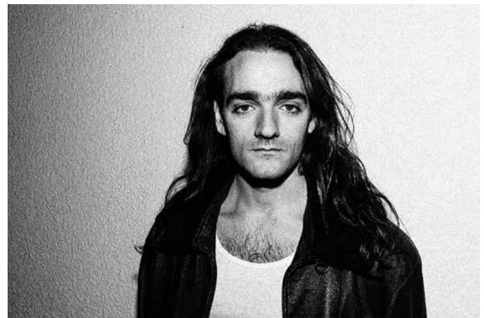
Imatge promocional de l'artista a les xarxes.