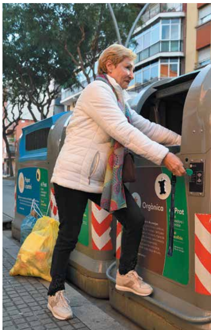
Una dona diposita la brossa al contenidor de l'orgànica, a Carretera de la Marina