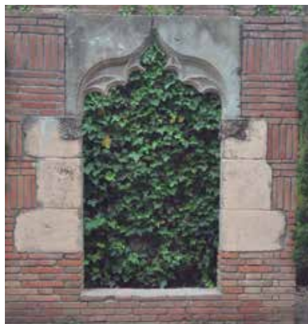
Un dels finestrals gòtics ubicats als jardins de la Torre Muntadas / Foto: PAU RODRÍGUEZ, any 2023

La gran heretat, de 186 mujades arribà a tenir al llarg dels segles petites masies sufragànies: Cal Xic d'en Donyanna, Can Donyanna o Ca l'Ixo. L'agost de 1556 dues mujades de la finca van ser cedides per a