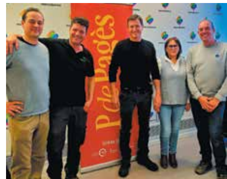
Presentació de la marca a Mercabarna, el 30 de gener

S'ha fet una reserva de 26 habitatges destinats a la COV, en què caldrà aportar certificat de vinculació a la cooperativa, emès per aquesta entitat. ◀