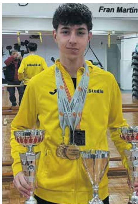
Daniel López / Foto: SFM