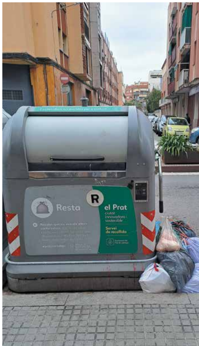
Bosses d'escombraries fora dels contenidors / Foto: S. Olivera

Les poques dades recaptades de les primeres setmanes de funcionament dels contenidors intel·ligents a la fase 1 sembla que