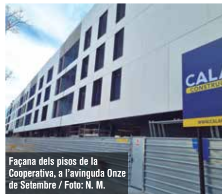
Façana dels pisos de la Cooperativa, a l'avinguda Onze de Setembre

De la totalitat dels pisos, se'n sortejaran 91 entre tots aquells inscrits que compleixin els requisits, i 10 quedaran reservats per a Prat Espais, que els destinarà a l'allotjament de persones en risc d'exclusió residencial.