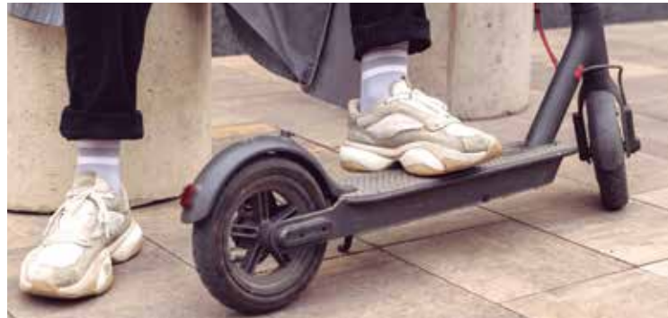
La moció aprovada donarà peu a una ordenança més restrictiva amb patinets i bicicletes

“Els patinets s'han convertit en un pro-