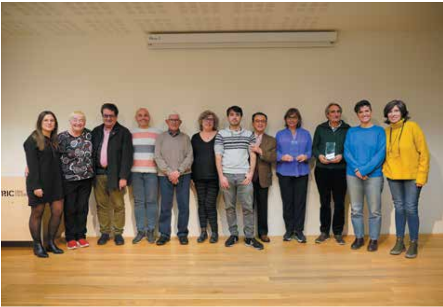
Foto de família amb premiats, organitzadors, jurat i autoritats.