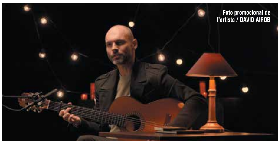
Foto promocional de l'artista