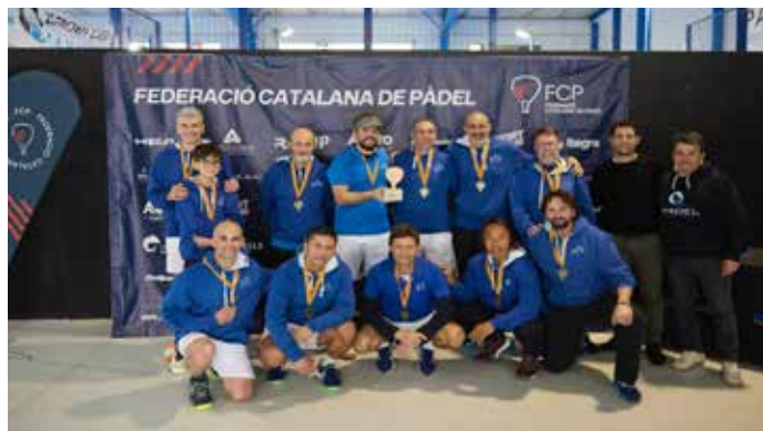
Equip veterà del Pàdel Barcelona-El Prat.