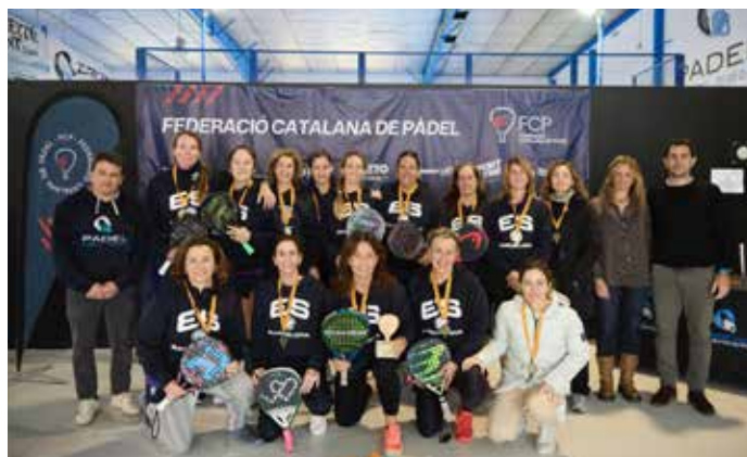
Equip veteranes de l'Emilio Sánchez CE.