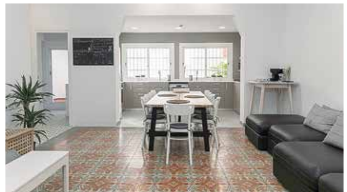
Un dels espais comuns de la residència, segons imatge del projecte original

L'espai ideal per construir aquesta idea va arribar per casualitat, quan passejava el seu gos. "Vaig començar a parlar amb un senyor, li vaig explicar la meua idea i que buscava un edifici on fer-la possible, i als cinc dies em va trucar que tenia el lloc ideal, es llogava una casa al carrer Jaume Casanovas. I m'hi vaig enamorar". La finca estava força cuidada, però s'havia de rehabilitar segons les normatives, i que les persones amb discapacitat poguessin tenir-hi accés. Can 19 disposa de nou habitacions, cadascuna amb la seva dutxa. "Jo hagués volgut que totes tinguessin lavabo i dutxa a dins però