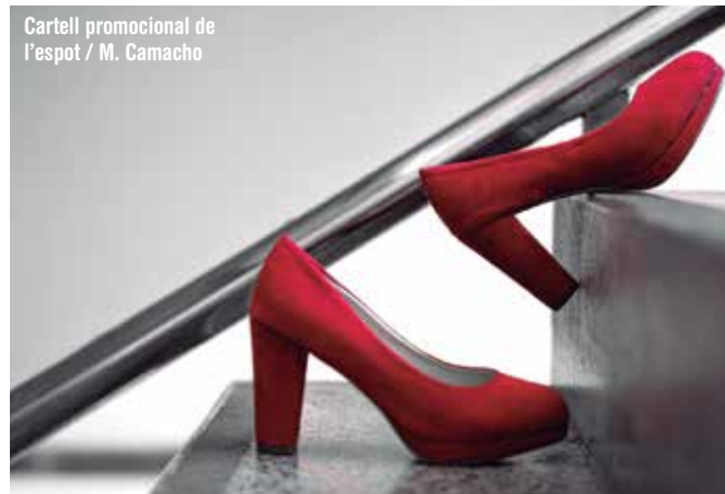
Cartell promocional de l'espot