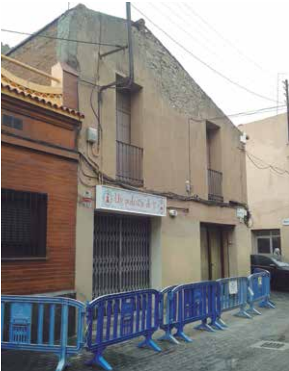
Part superior d'una façana caiguda pel vent, al c. Ferran Puig