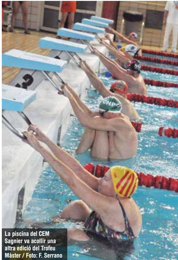
La piscina del CEM Sagnier va acollir una altra edició del Trofeu Màster

REDACCIÓ / El dissabte 8 de febrer la piscina del Complex Esportiu Municipal Sagnier es va omplir de competidors majors de vint-i-cinc anys per celebrar la 13a edició del Trofeu Màsters Ciutat del Prat de natació. La prova disputada al Prat i organitzada pel Club Natació Prat va ser la setèma de les setze que consta el circuit català de trofeus de Natació per veterans i on es va disputar les següents proves: màster 100, màster 500, trofeu velocitat, trofeu especialista i trofeu de fons. ◀