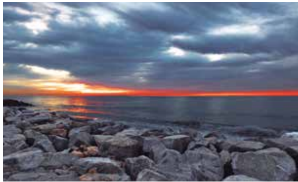
Abaix, la platja, sense sorra, prop del centre de vela, el dia 11 de febrer, l'endemà del temporal