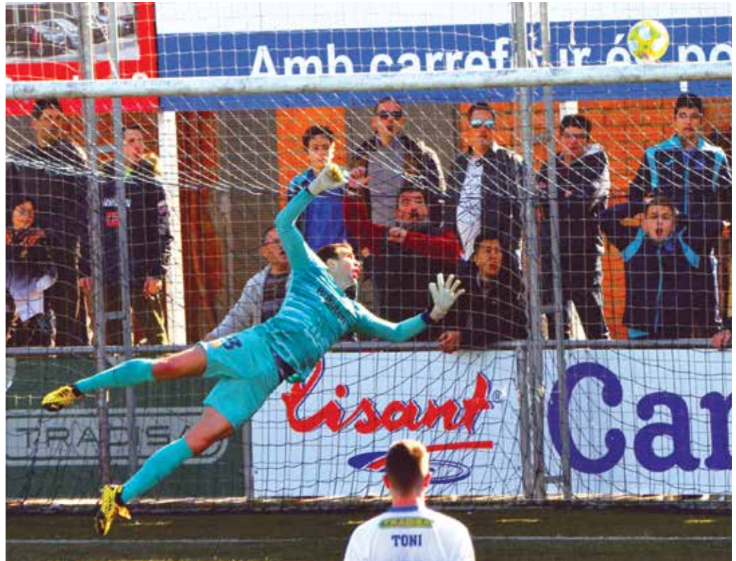
Injusta derrota del Prat ante el Barça B en el Sagnier

nista llevarse la victoria del Sagnier. El equipo pratense fue superior al azulgrana, pero un penalti muy dudoso puso por delante a los barcelonistas. El Prat creó muchas ocasiones, pero no fue hasta el tramo final cuando Raillo empató. Los de Pedro Dólera fueron a por el segundo gol, pero lo que llegó al final fue el gol del Barcelona B.