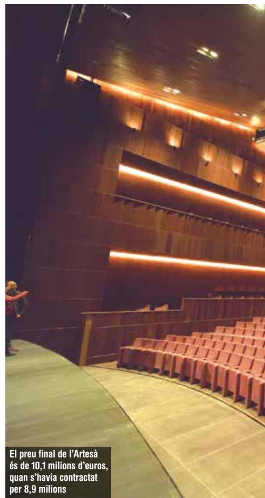
El preu final de l'Artesà és de 10,1 milions d'euros, quan s'havia contractat per 8,9 milions