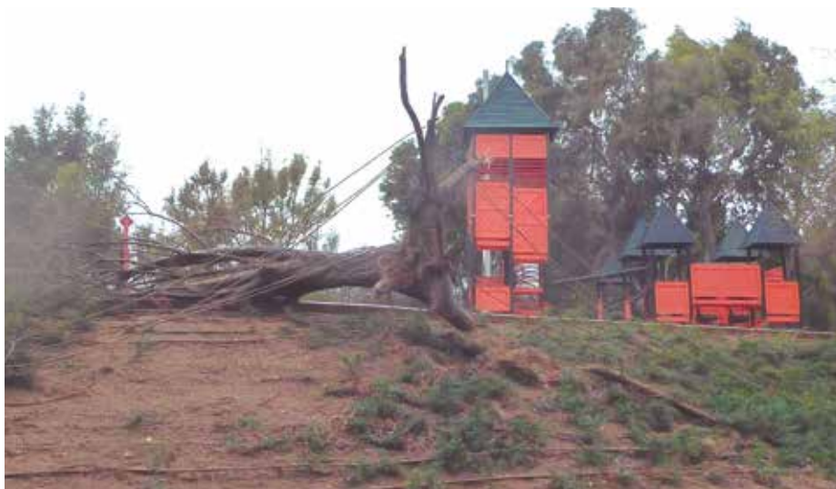
Arbre fixat amb cordes després de caure a la zona infantil del parc de la Solidaritat