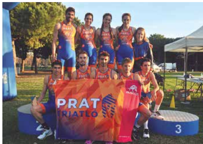
Excel·lent actuació dels equips masculí i femení del Prat Triatló / Foto: F. Serrano

La participació total tant a la prova elit com l'open va ser de record, amb uns 1300 espor-