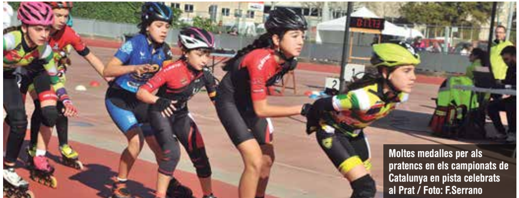
Moltes medalles per als pratencs en els campionats de Catalunya en pista celebrats al Prat

El pratenc segueix amb la seva progressió i va aconseguir a la Copa del Món de Calgary (Canadà) absoluta la millor marca mundial junior als 1.000 m., tercera marca junior global i record d'Espanya. ◀