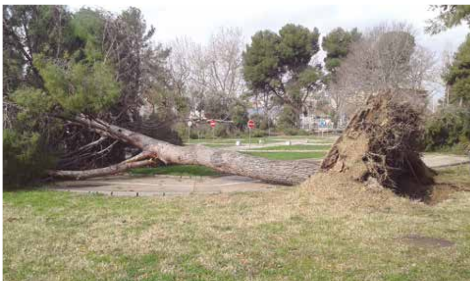
Arbre arrencat d'arrel i caigut sobre la pista infantil d'aprenentatge viari del Parc Nou