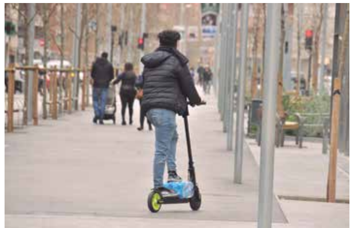
Patinet pel mig de l'Av. Montserrat

Només en el cas que no hi hagi aglomeració de vianants,