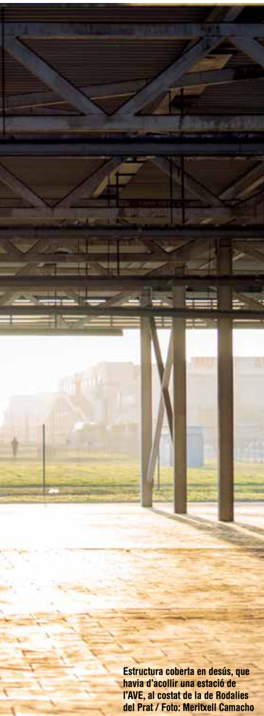
Estructura coberta en desús, que havia d'acollir una estació de l'AVE, al costat de la de Rodalies del Prat

una conferència del Cercle d'Infraestructures organitzada per la revista El Llobregat, “és necessari incrementar la quota de ferroviària que ara mateix és d'un 30% per vehicles i d'un 14% per a contenidors. El tren és un mitjà més net i això ajudaria molt a reduir les emissions”.