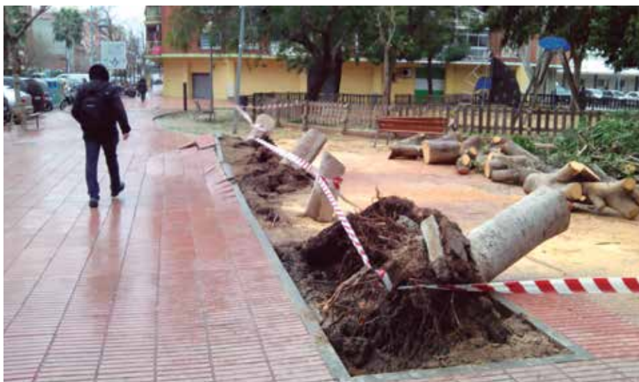
El terra, aixecat a l'avinguda del Remolar per l'efecte palanca de les arrels dels arbres tombats

L'alteració del sistema natural de sedimentació del riu des de la modificació de la desembocadura no és cap controvèrsia nova.