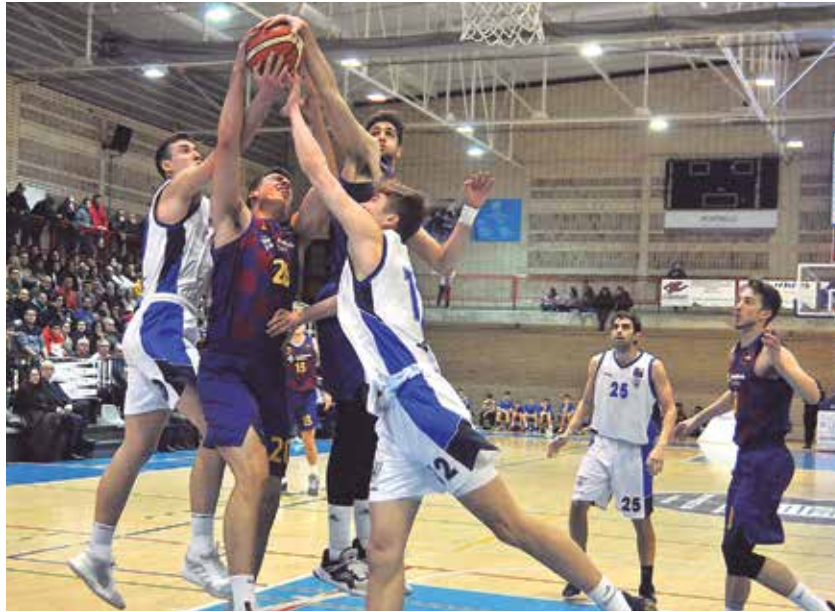
El CB Prat amb els deures fets de mantenir la categoria comença la lliga d'ascens a Or.

En el grup per aconseguir l'ascens es comptabilitzen els resultats obtinguts contra els rivals que ja s'han enfrontat i això fa que el CB Prat surti a la part alta per tenir ja assegurades 4 victòries davant el Múrcia (2), Girona (1), Menorca (de moment 1) i les possibles del Gran Canària (2) o l'Hospitalet (1), ja que ara com ara encara no és segur qui acompanyarà a Múrcia, Girona, Menorca i Prat en els dos llocs que resten i pel que lluitaran