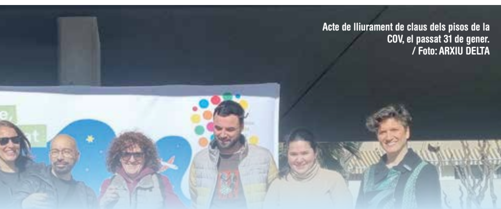
Acte de lliurament de claus dels pisos de la COV, el passat 31 de gener.

obres, les de la residència de gent gran i el bloc que construeix Prat Espais, l'aigua del subsol s'ha mogut. Ha començat a ploure i l'aigua ja pujat de nivell i s'ha filtrat al nostre soterrani". El dia que es van lliurar les claus, el pàrquing de l'edifici tenia un dit d'aigua. "Vam contactar amb TIMPER, empresa que s'encarrega de la impermeabilització de la cimentació. Vam començar a injectar a la llosa per segellar la fissura per on entrava l'aigua. Però l'aigua va trobar altres forats per colar-s'hi. Ara ja està tot sec".