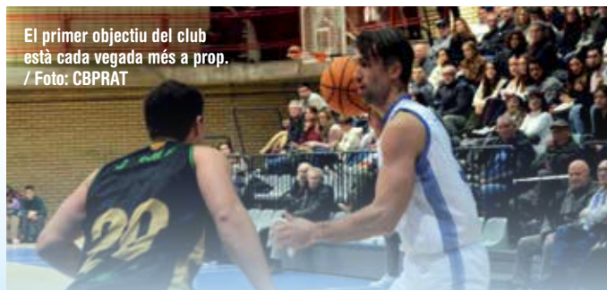
El primer objectiu del club està cada vegada més a prop. / Foto: CBPRAT

amb més victòries, mentre que el que perdi tindrà una nova oportunitat a casa davant del millor de l'eliminatòria entre els tercers dels dos grups, però sense tenir la condició de cap de sèrie. Victòries clau prèvies: Navàs i Esparreguera. Guanyar a Navàs no va ser fàcil. Els locals volien acostar-se al lideratge, però la superioritat del Prat va quedar cla-