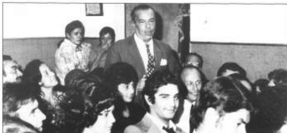
Setembre, 1971. Grup d'assistents a l'inauguració del nou local social de la A. Cervantes.