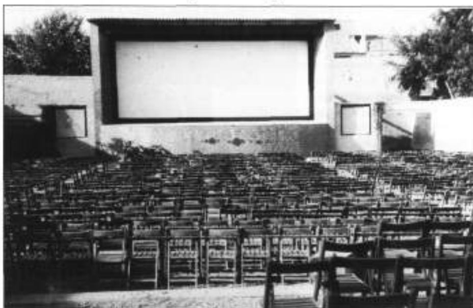
El cinema d'estiu del Monmari (1958-1974)

El 1956 es va consolidar també la posició econòmica de la nostra família amb la cancel·lació de tots els préstecs hipotecaris pendents, quedant nets de deutes. El maig de 1957 a l'Artesà es varen trobar que havien de fer front a unes obligacions que tenien amb el cafeter, que havia acabat el contracte d'arrendament i se n'anava, i a la