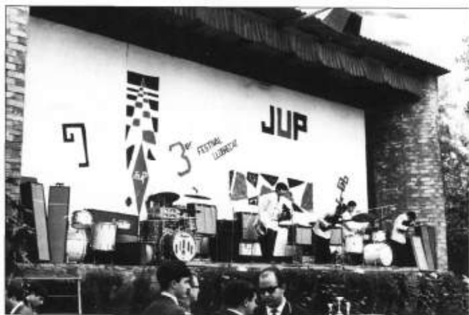
Festival de Música Moderna al Cinema d'Estiu

Els espectacles de varietats van començar cap a la meitat de l'etapa, el 1966, amb les més destacades companyies folklòriques del moment: El Príncipe Gitano (dues vegades), Julianelly, La Niña de la Puebla, Antonio Molina (dues vegades), Jua-