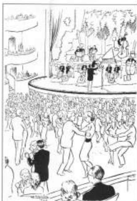
Ball de Festa Major al Centre Artesà. Dibuix de l'Àngel Garcia publicat al programa oficial de 1947

Gray", "El hombre fenómeno", "Enamorada", etc.